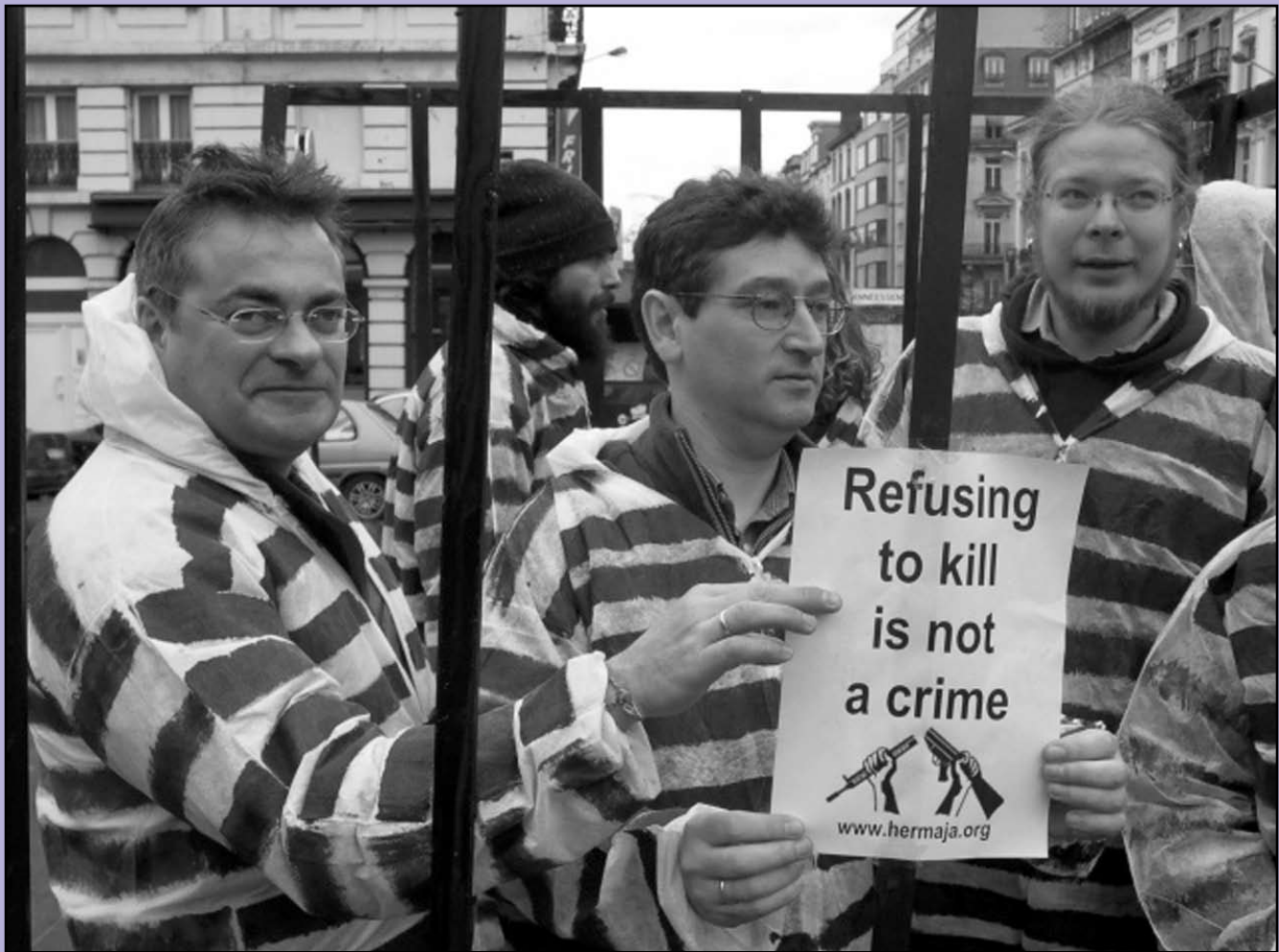
For Mother Earth

K ansainvälisen rauhanvankipäivänä 1.12.2003 järjestettiin toiminta suomalaisten aseistakieltäytyjien puolesta eri puolilla Eurooppaa. Brysselissä mielenosoittajista 19 puoleutuivat vankipukuihin ja asettuivat kalterihäkinsisäänsymboloiden suomalaisiamielipidevankieja. Paikalliset vihreät kansanedustajat