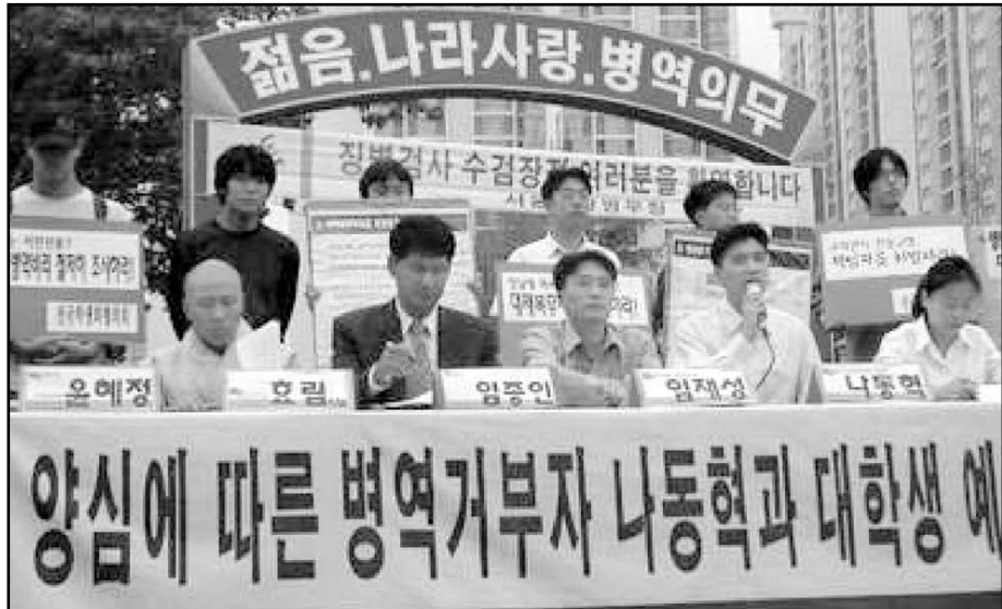
Korealaisia aseistakieltäytyjiä julistamassa vakaumuksensa armeijan miesvahuustoimiston edessä Soulissa 12 syyskuuta 2002

Rauhanvankipäivän 1.12. kansainvälinen teema on tänä vuonna Etelä-Korea. Maassa on pakollinen asevelvollisuus, eikä mitään aseistakieltäytymismahdollisuuksia. Jehovan todistajia on maassa tuomittu vankeuteen jo pitkään, mutta uudella vuosituohannelle myöskin poliittinen aseistakieltäytyjäliike on nostanut päätään.