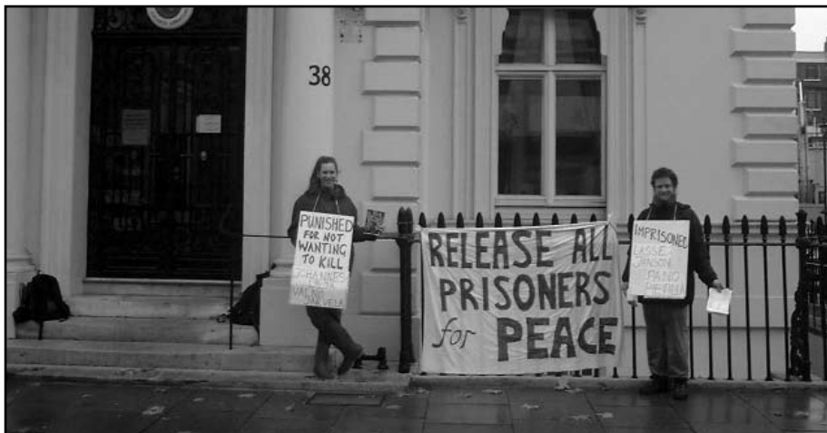
Myös Suomen suurlähetystön edustalla Lontoossa osoitettiin mieltä mielipidevankien puolesta