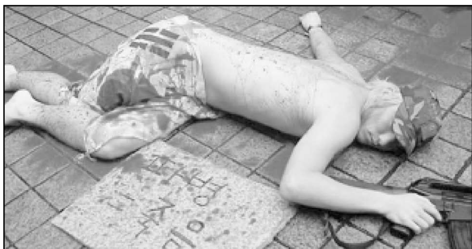
Etelä-Korealaisten joukkojen lähettämistä Irakiin vastustava performanssi Soulissa syyskuulla 2003

Vuonna 2002 useat ihmisoikeusryhmät muodostivat "Korea solidarity for Conscientious Objection" (KSCO)-liikkeen, ja erästuomarivetos perustuslakituomioistuimeen, koska epäillään voimassa olevan asevelvollisuuslain perustuslainmukaisuutta. Oh Tae-yangin julistauduttua aseistakieltäytyjäksi poliittinen aseistakieltäytyminen on yleistynyt. Tähän mennessä aseistakieltäytyjiä on