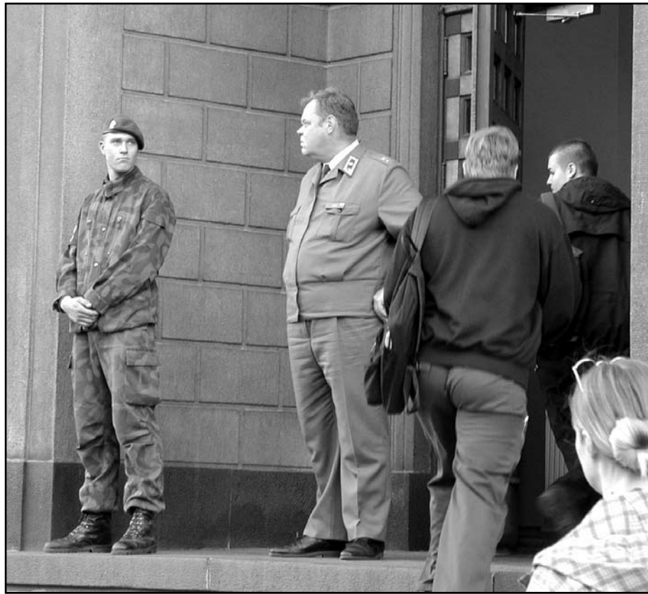
Helsingin kutsunnat syksyiltä 2000